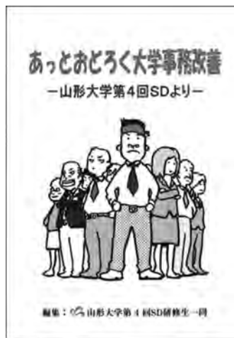
冊子「あっとおどろく大学事務改善」の表紙（資料1）

このアクションプランが後の山形大学SDにつながりました。山形大学では平成15年に第1回SDが開催されましたが、山形大学創出プロジェクトとして「事務職員として山形大学をどのようにしていきたいか」について考えました。その結果として作成したアクションプランを発表しました。発表した中の優れた企画には学長が予算を付け、私達が提案したアクションプランから実際に実現したものがいくつかありました。その後の第4回SDでは「あっとおどろく大学事務改善」という冊子を作り（資料1）、全国の大学に配布しました。