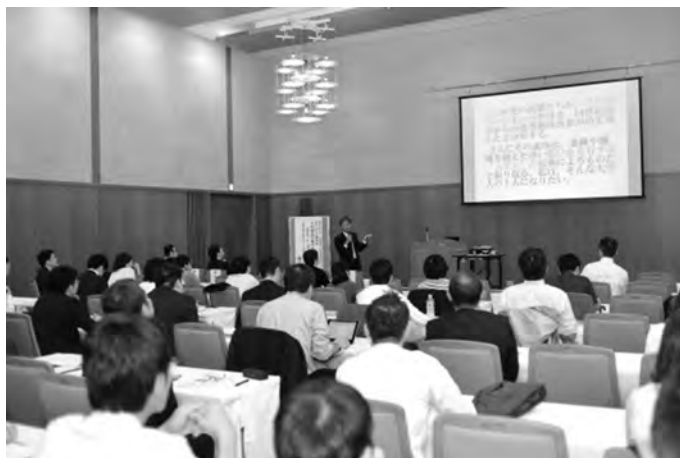
SD講演会 会場の様子

最後に、肩書は大学職員でもアドミニストレーターでも高度専門職でも何でもいいのですが、とにかくアウトプットできないと無責任ですので、制度やルートが無いことを嘆かず、自分なりの大局観とイメージを持って行動することが一番だと思っています。