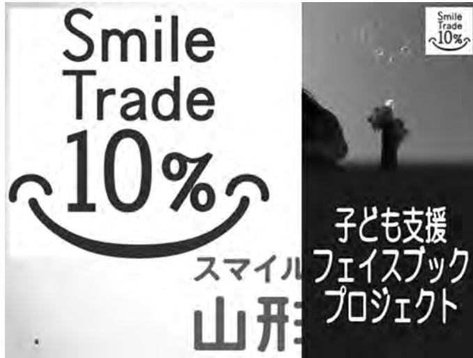
子ども支援フェイスブックプロジェクト (資料2)

仕事上では大学連携担当として「南東北大学連携研究会」を立ち上げました。宮城教育大学と福島大学、山形大学の南東北・国立3大学で立ち上げた研究会です。副学長をトップに議論を展開し、「災害復興学」という教養教育プログラムを3大学協働でつくりました。