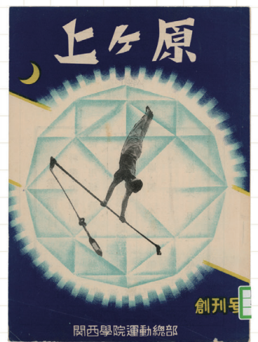
『上ヶ原スポーツ』創刊号 1949年11月3日付