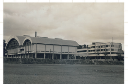
総合体育館と学生会館旧館 1959年頃