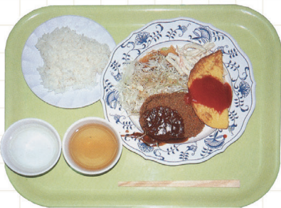
コーブランチ(BIG PAPA) 1995年 (『関西学院大学卒業アルバム』)