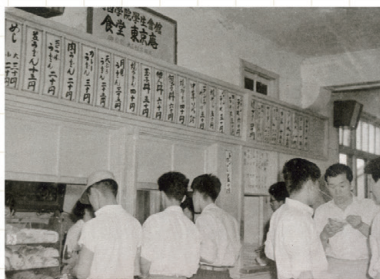
東京庵 1958年(『商学部卒業アルバム』)