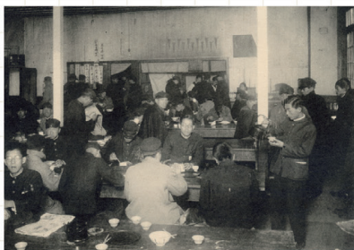
原田の森時代の学生食堂 1929年 (『高等商業学部第14回卒業アルバム』)

表面使用画像(右上より時計回りに)：ホットケーキ(Arcadia)2020年(『関西学院大学卒業アルバム』)、弓道部1928年(『文学部第11回卒業アルバム』)、九州沖縄フェアの熊本ラーメン(BIG PAPA)2025年、相撲部1928年(『高等商業学部第13回卒業アルバム』)、管理栄養士定食(BIG PAPA)2025年、学院食堂の食器1950年代-1978年か、学生食堂1934年(『高等商業学部第19回卒業アルバム』)、アイスホットケーキ部1999年(『関西学院大学体育会卒業アルバム』)、水上競技部1929年(『高等商業学部第14回卒業アルバム』)、豚生姜焼き定食(カスタマイズ後)(東京庵)2024年、柔道部1928年(『高等商業学部第13回卒業アルバム』)