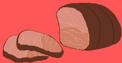
ダッチオーブンで作る ローストビーフ