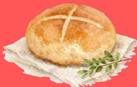
生地からこねて自ら焼く! 石窯パン