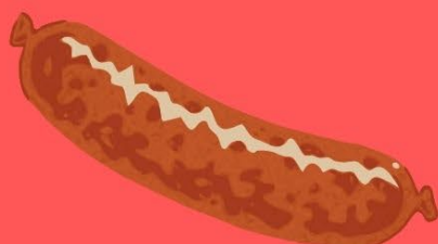
腸詰から味付けまですべて!? ソーセージ