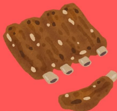
ほろほろで食べ応え抜群 スペアリブ