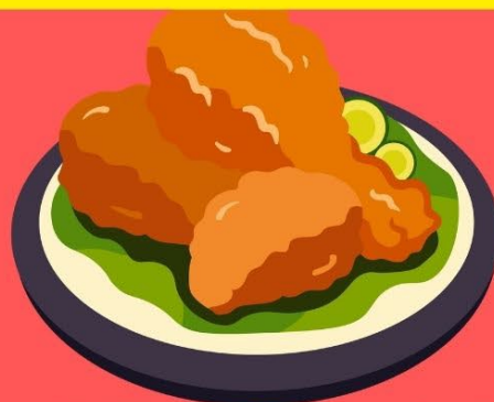
鉄板でパリッ焼く ローストチキン