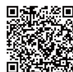
本学大阪梅田キャンパスまでのアクセスマップ

■主催：関西学院大学 総合政策研究科リサーチ・コンソーシアム HP アドレス https://www.kwansei.ac.jp/s_policy/s_policy_009677.html