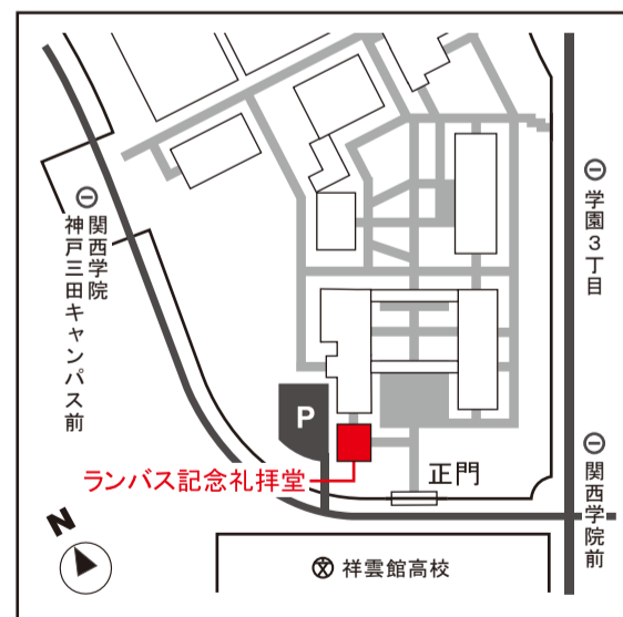
● 神戸三田キャンパス(KSC)MAP