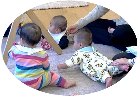
何を見ているのかな？