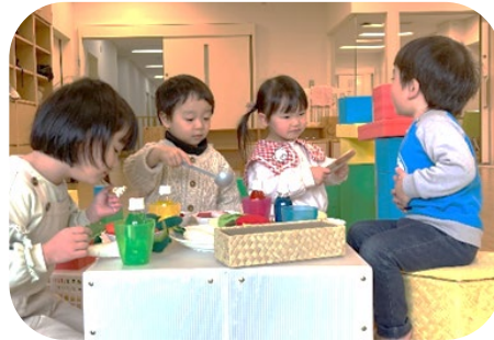
家族「うん、楽しいね」