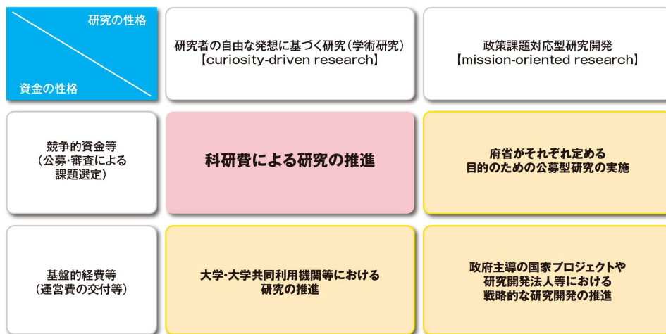
我が国の科学技術・学術振興方策における「科研費」の位置付け