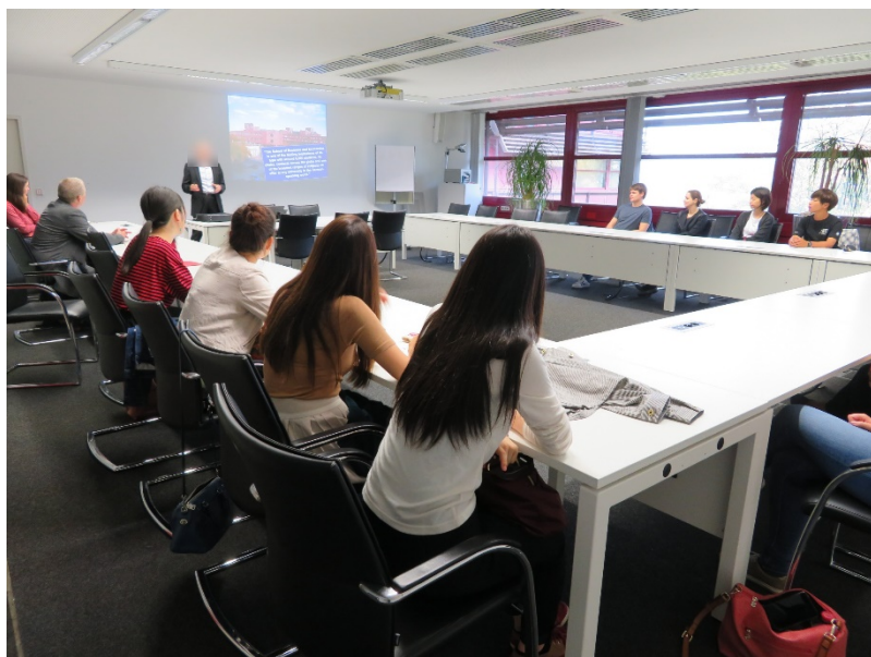
ドイツの協定校、エアランゲン・ニュルンベルク大学で講義