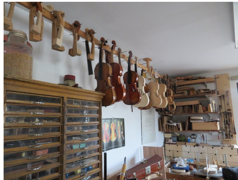
ドイツ・ブーベンロイトのバイオリン工房