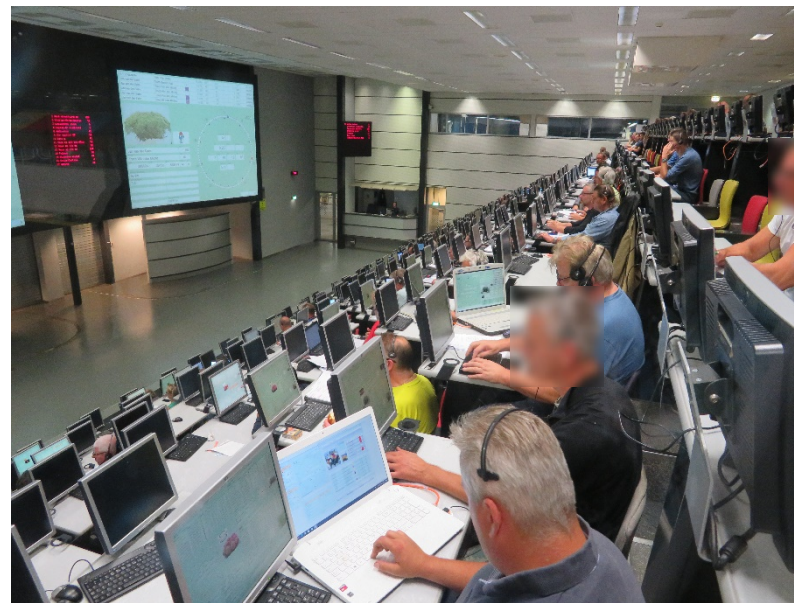
アールスメールのセリの様子