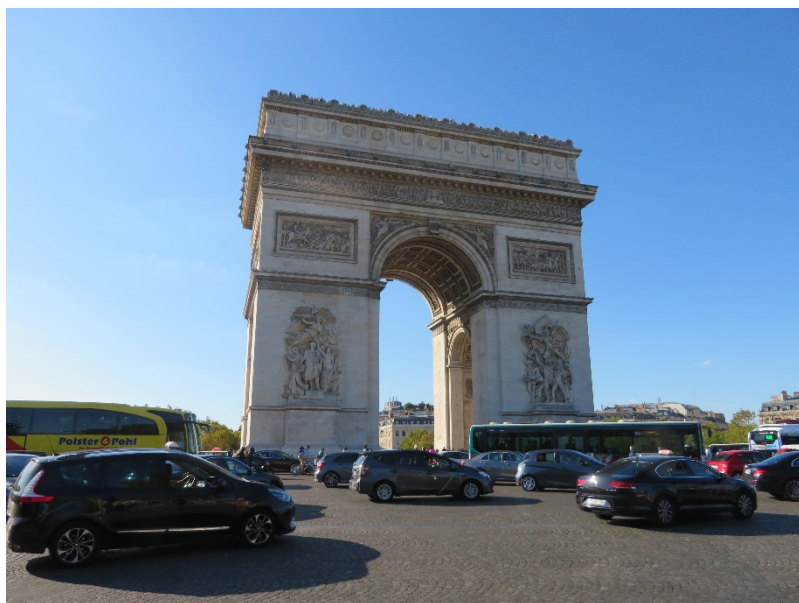
フランス・パリの凱旋門