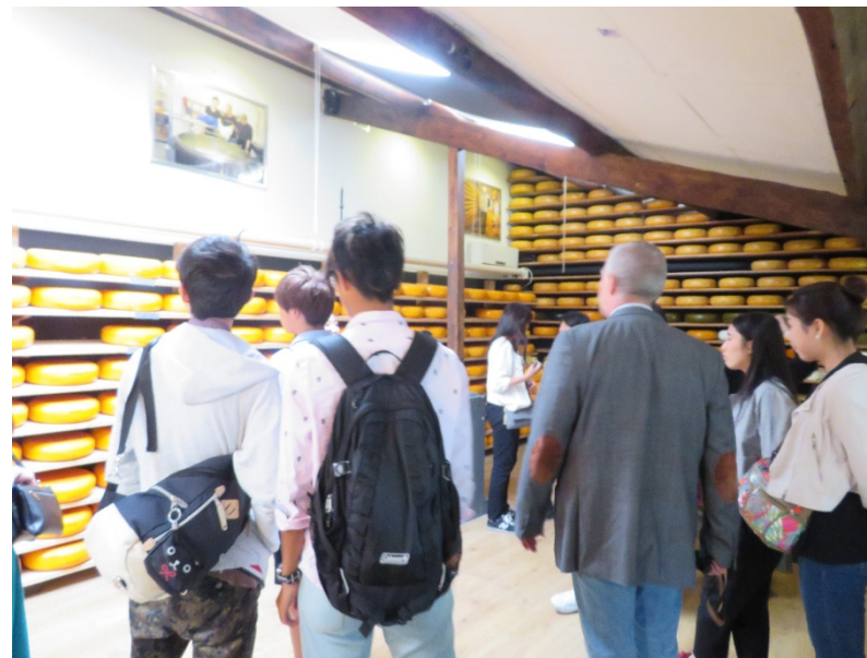
ゴータチーズに感動。