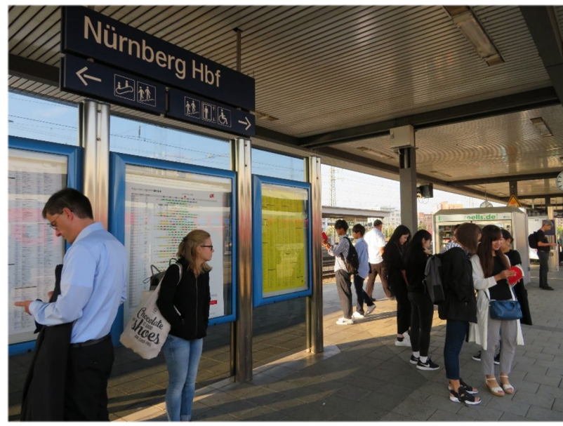
ドイツ2日目、ニュルンベルク駅でミュンヘン行きの列車を待つ。