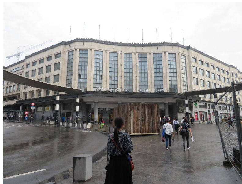
欧州議会からグランプラス（町の中心地）に向かう。