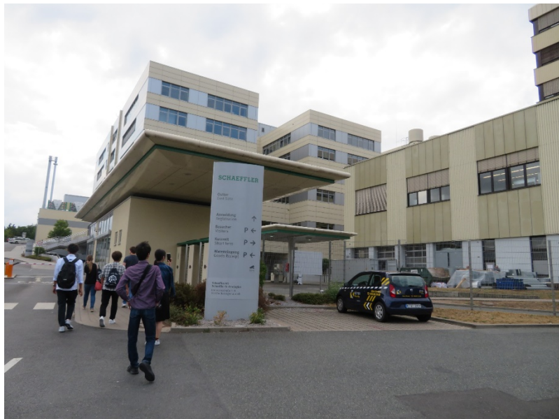
ドイツ・シェフラー（高精密機器メーカー）を訪問、工場見学をおこないました。