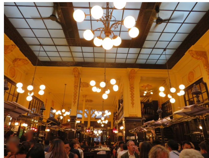
フランス・パリのビストロで晩御飯