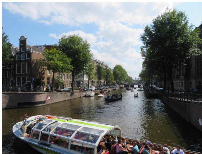
オランダ・アムステルダムの街並み