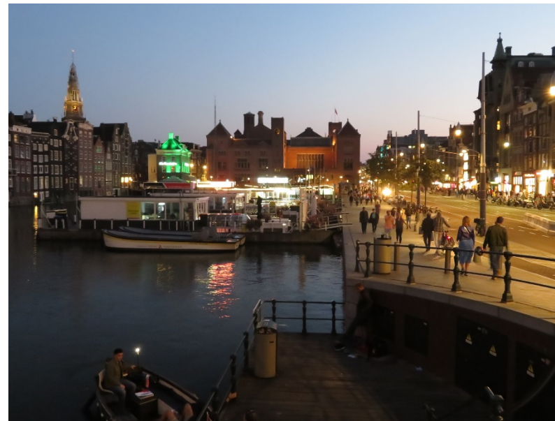
オランダ・アムステルダムの街並み