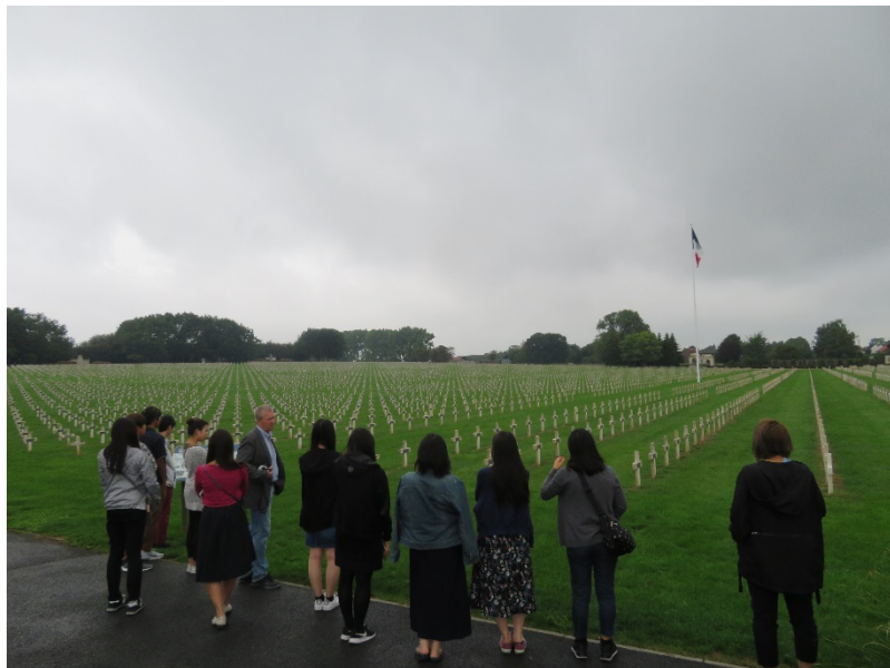
第一次世界大戦で亡くなった兵士の墓、フランスにはこのようなお墓が多くあります。