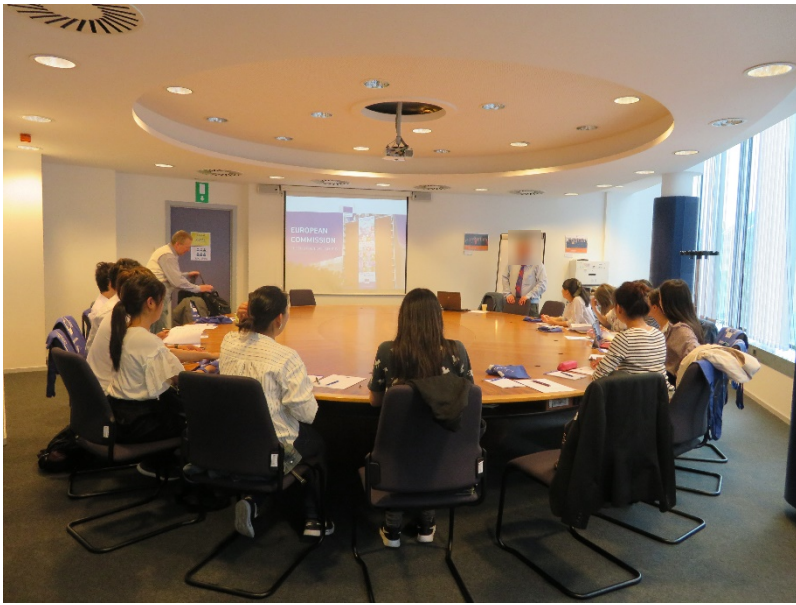
ベルギー・ブリュッセルの欧州委員会で講義