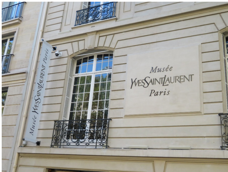
フランス・パリのイブ・サンローラン美術館