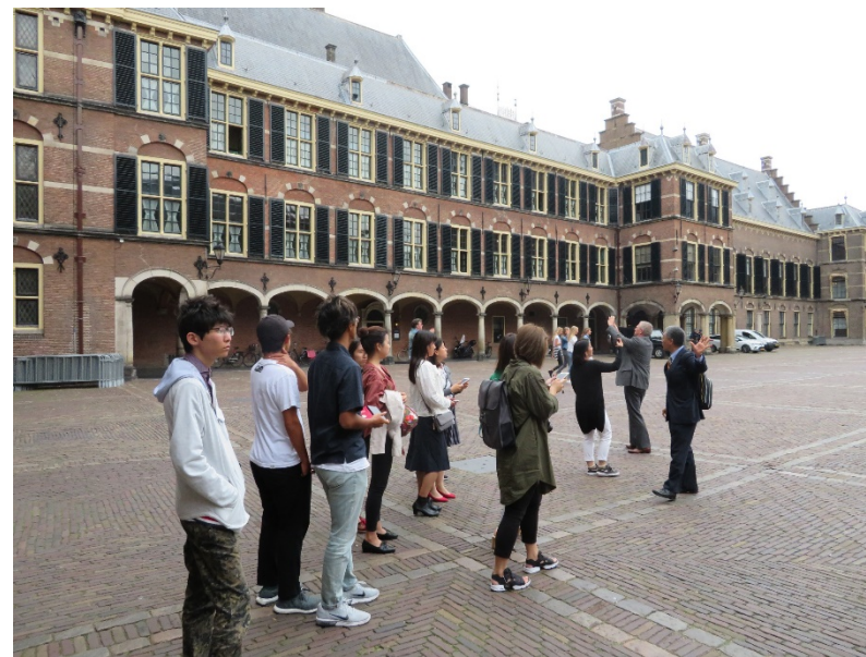
オランダ・デンハーグを散策