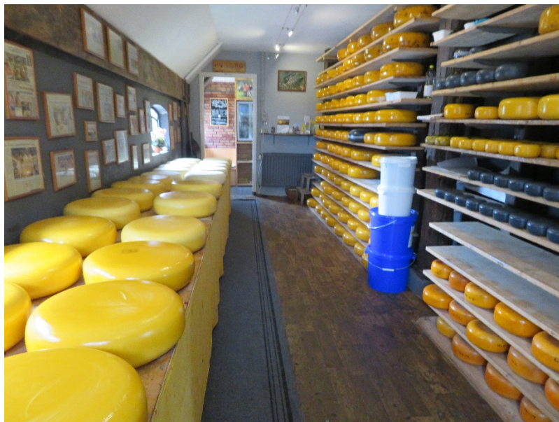
ゴータチーズ。1つ13キロだそうです。