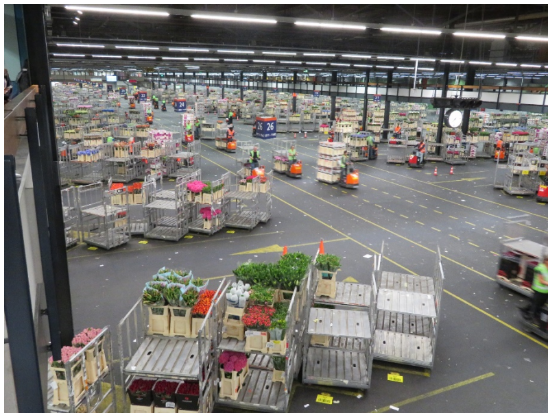
オランダ・世界最大の花市場（アールスメール）