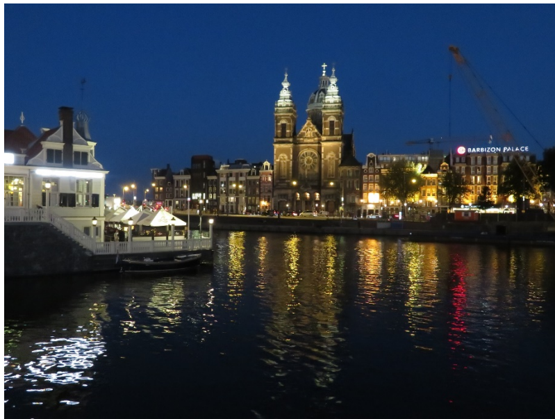
オランダ・アムステルダムの街並み