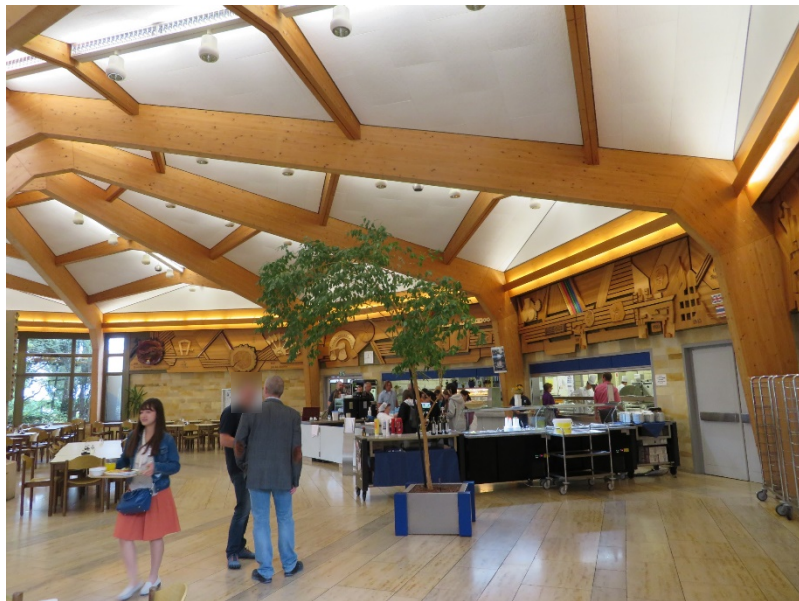
ドイツ・STAEDTLERの社員食堂でランチ