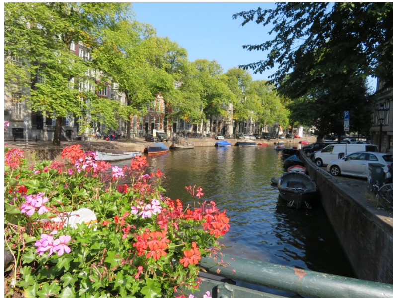
オランダ・アムステルダムの街並み