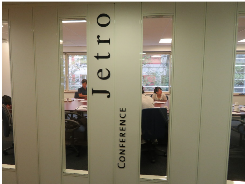
フランス・パリのJETROパリオフィスを訪問