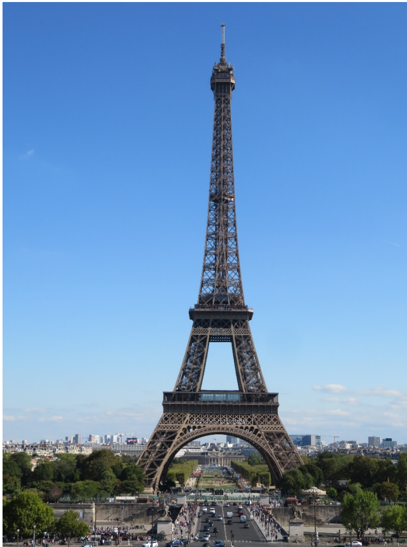
フランス・パリのエッフェル塔