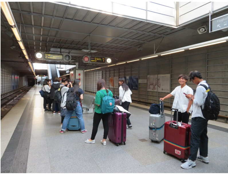
ドイツ到着。ニュルンベルク空港駅でニュルンベルク市内に向かう電車を待つ。