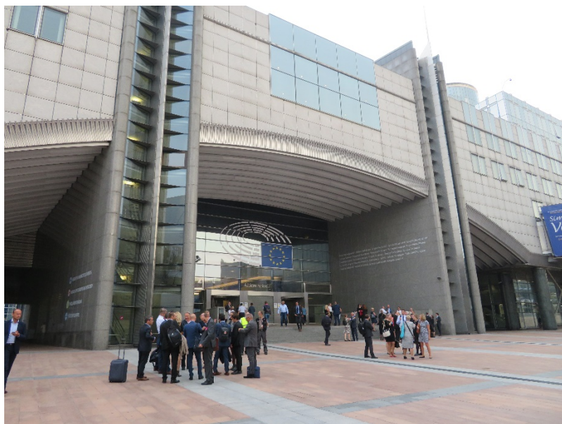
欧州議会近くの広場