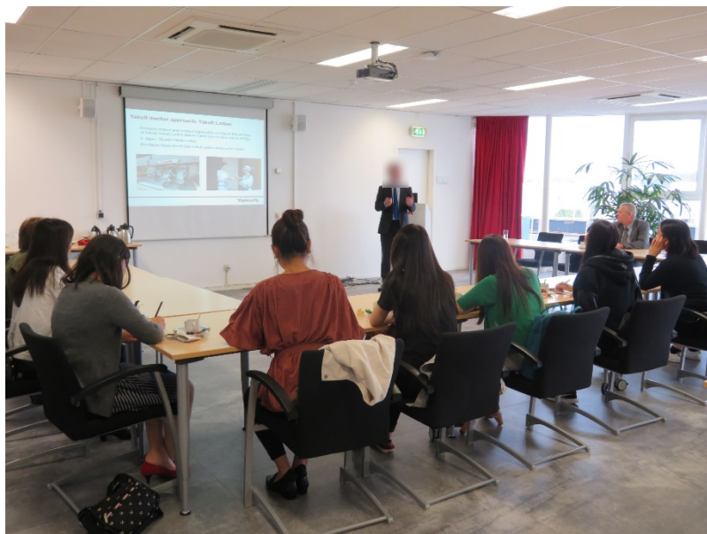
オランダにあるヨーロッパ・ヤクルトを訪問、ヤクルト生産ライン見学のほか、講義をしていただきました。