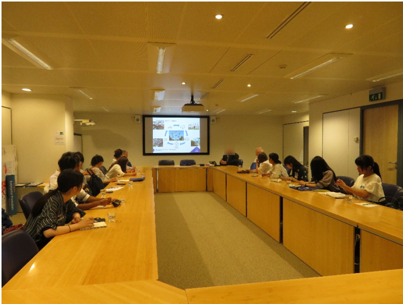
ベルギー・ブリュッセルのEU地域委員会で講義