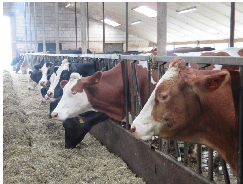
オランダ・ゴータチーズ農場の牛たち