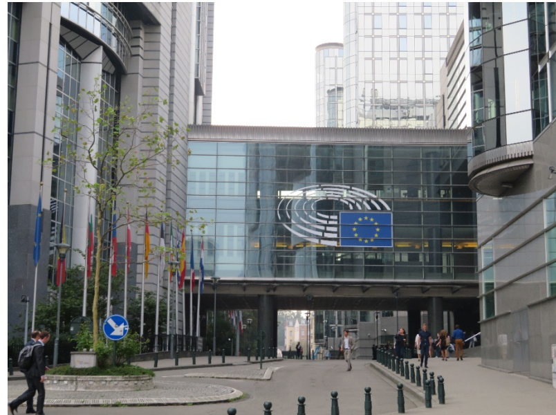
ベルギー・ブリュッセル、欧州議会に向かう。