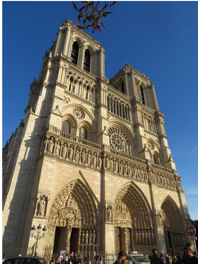
フランス・パリのノートルダム大聖堂