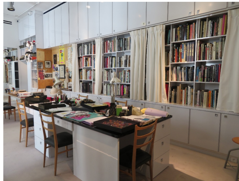
フランス・パリのイブ・サンローラン美術館