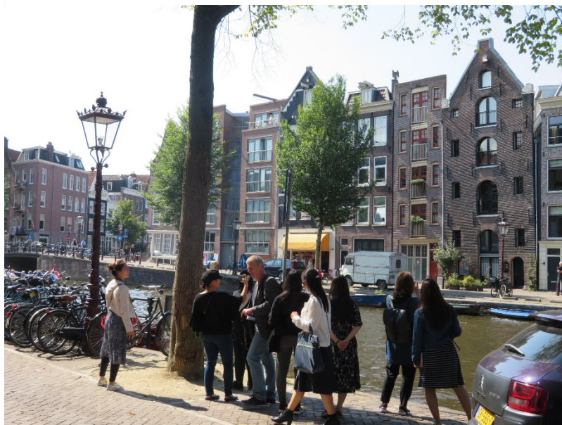
オランダ・アムステルダムの街並み