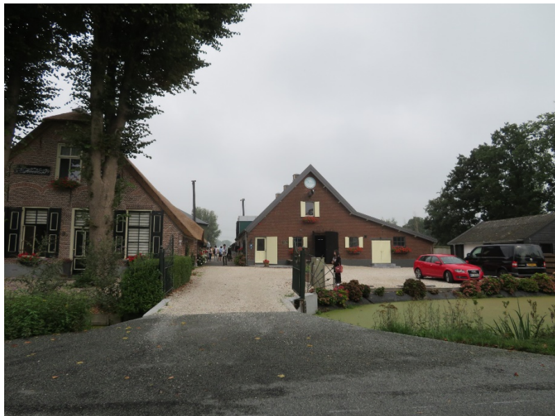
オランダ・ゴータチーズ農場を訪問