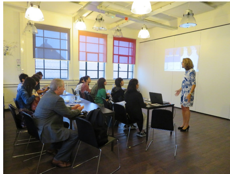
オランダ・ロイヤルデルフトでの講義