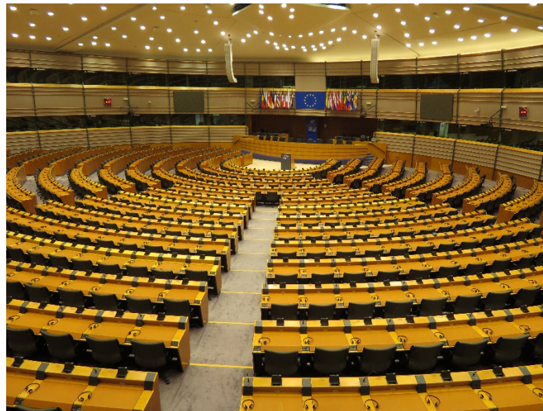
欧州議会に座席も多いが、通訳ブースも多い。