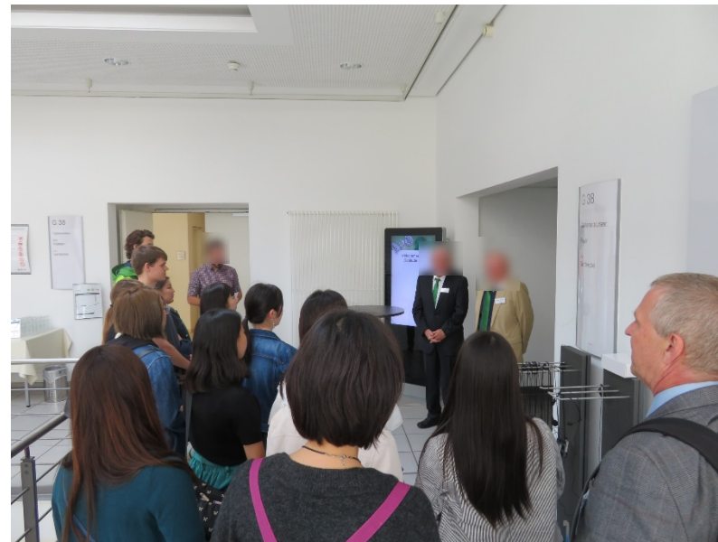
ドイツ・シェフラーでは社員の方がツアーをしてくださいました。