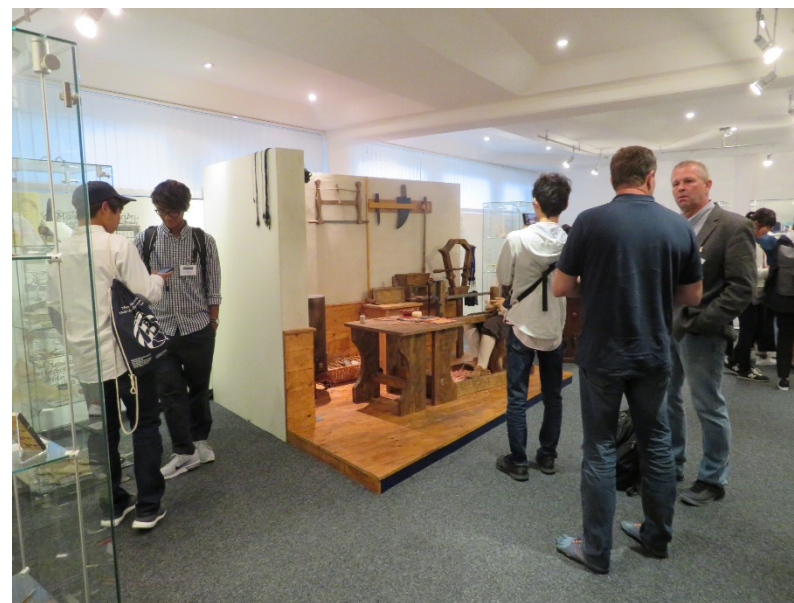
ドイツの文具メーカーSTAEDTLERを訪問し、鉛筆生産ライン等を見学しました。