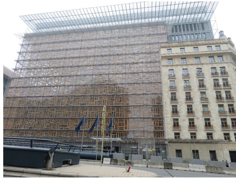
ベルギー・ブリュッセルにはEU関連の建物がたくさん！