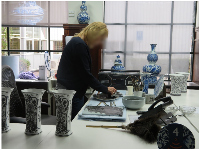
オランダ・ロイヤルデルフトの工房