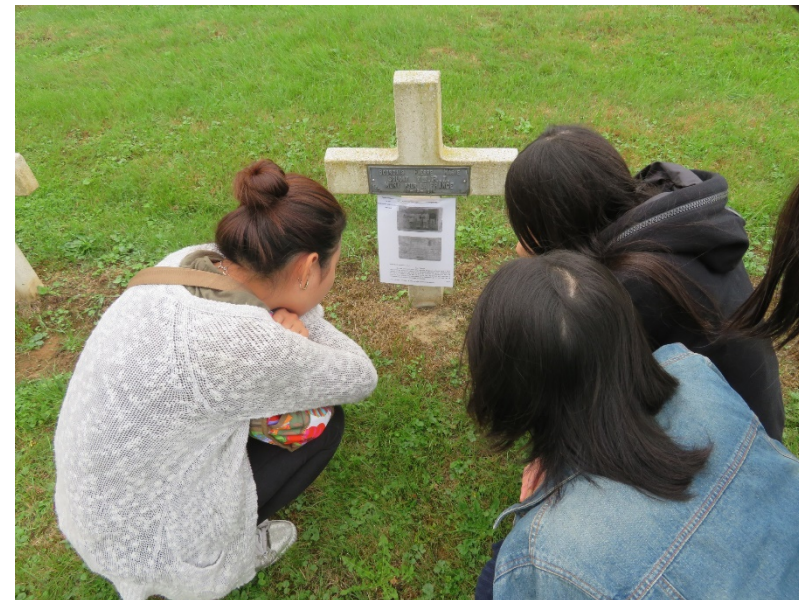
お墓には家族によるメッセージが貼られていたりもします。