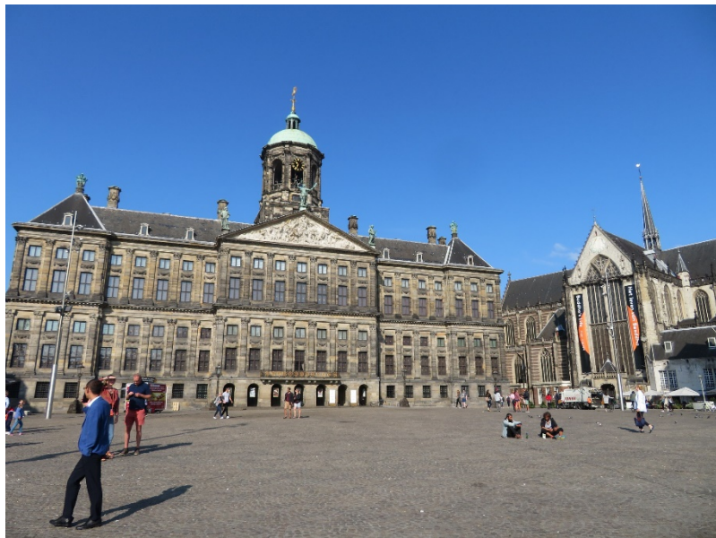
オランダ・アムステルダムの街並み