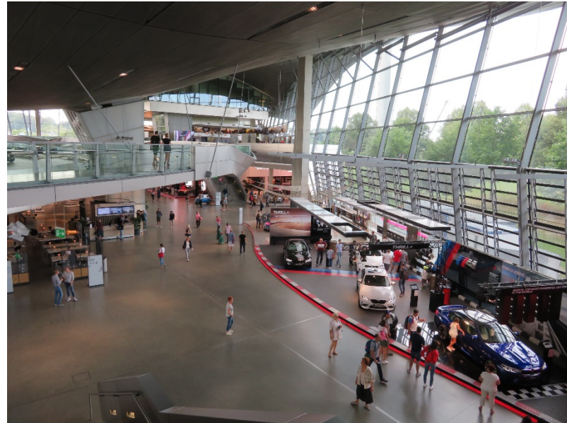
ドイツ・ミュンヘンのBMWワールド