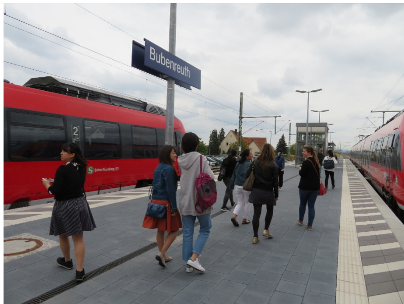
ブングシェ教授の故郷、ブーベンロイトへ