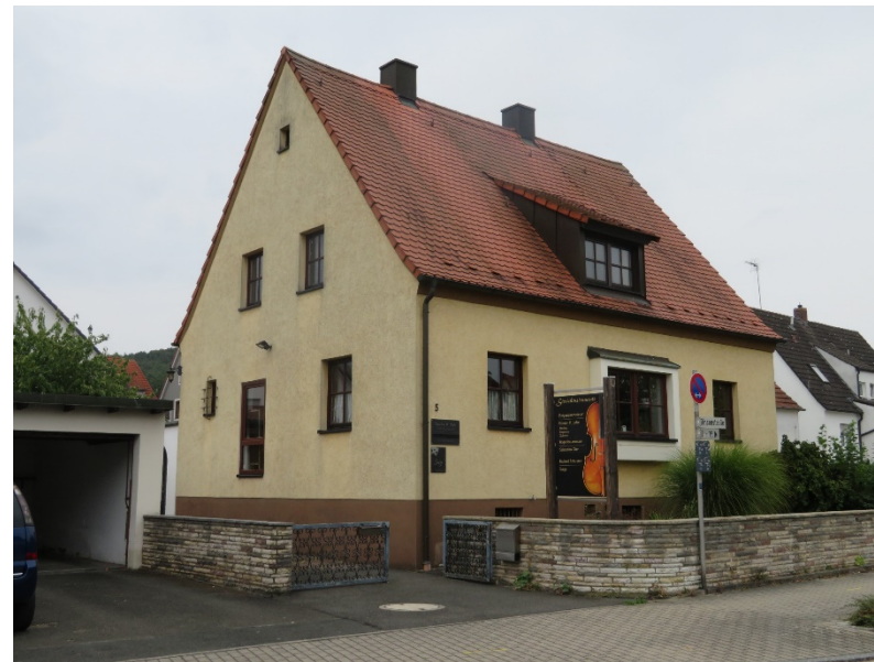
ドイツ・ブーベンロイトのバイオリン工房