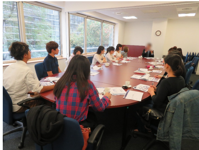
JETROパリオフィスでは、JETROのスタッフ とみずほ銀行のスタッフによる講義を受講