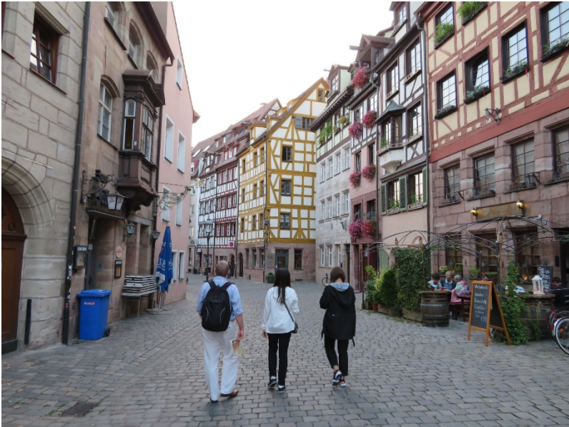
ドイツ・ニュルンベルクの街を散策