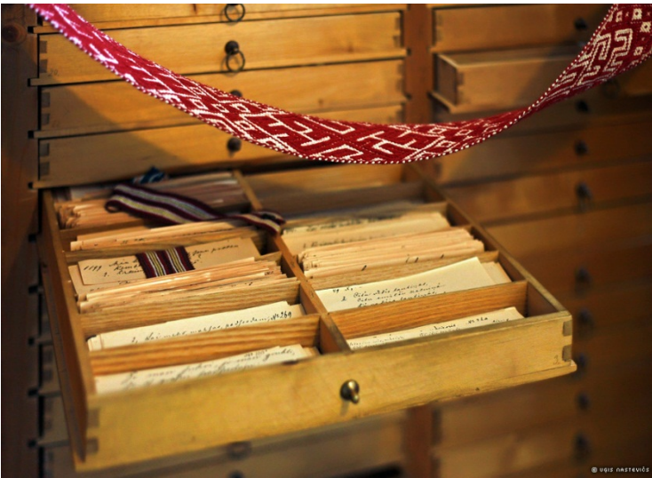
左:ラトビア神道の神典を含む民謡の戸棚とリエルワールデ帯 右:ラトビア神道の墓標、およびキリスト教との折衷による墓標