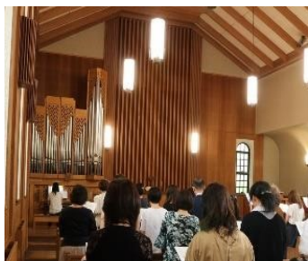
礼拝堂の厳かな雰囲気の中で、 聖書のお話を聴くと心に響きます。