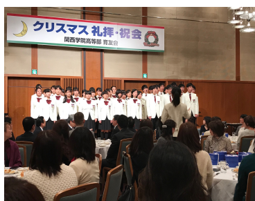
関学会館で行われるクリスマス礼拝と祝会。 心静まる礼拝と美味しいお食事で素敵なクリスマスを迎えます。