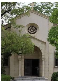
上ヶ原キャンパス内の ランバス記念礼拝堂。

※ 新型コロナウイルス感染症拡大防止の為、開催中止とさせていただく場合がございます。 中止の場合は、事前に Classi でご連絡しますので、ご確認くださいませようお願いいたします。