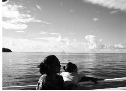
図23 夏季休暇を過ごしたメジャト島からイバイ島へ帰る親子

避難島で生産された保存食が分配される中で、都市部の人々は、避難島で作られたタコノキ羊羹の分配を受けるとともに、そのタコノキ羊羹を作った人の名を一緒に記憶する。現在人々が、ロンゲラップの他の人々との日常的な関係性を構築、および維持することが可能となっているのはタコノキ羊羹を求めることによってである。避難島で作られたタコノキ羊羹の5分の4は、避難島以外のイバイ、マジユロ、他の環礁、ハワイおよび米国のいくつかの場所に住む人々にも分配されている。多くは自身の子供、配偶者の兄弟姉妹や