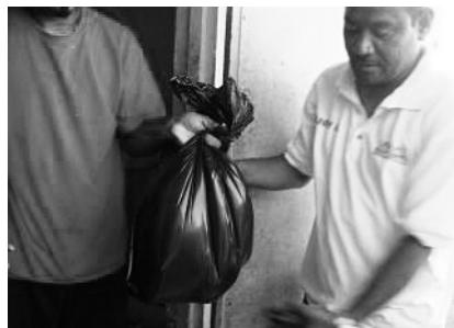
図26 魚の干物とココヤシをもらいに来る夫の親族