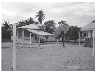
図5 島の中心部の診療所とラジオステーション