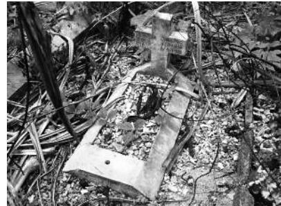
図20 エバドン島にある移住直後に亡くなったロンゲラップの人の墓