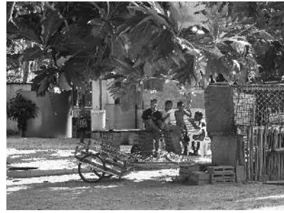
図3 昼下がり木陰で遊ぶ子供たち

ら210km東のロンゲラップ環礁の住民が被ばくし、急性放射線障害を発症し、3日後にアメリカ軍により救出された。アメリカの公文書によれば、この時計測した地上空間線量が毎時10mSvから23mSvあったことを示している。人々は、3年後に故郷へ帰還したが、出産異常やガンなどの健康被害が続出した。その後、公表された放射能の高さから、85年に再避難し、以後は故郷から210km南のメジャト島を中心的居住地として避難生活を続けている。