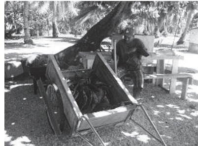
図 15 各世帯に届けられる大量の魚