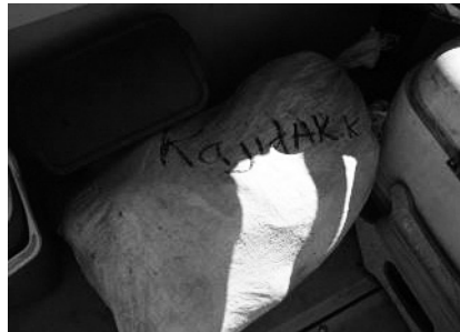
図24 メジャト島の保存食を船に乗せて娘に送る