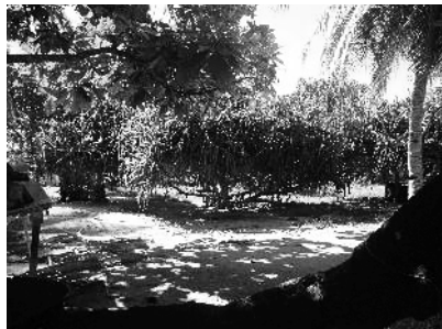
図9 植林後のタコノキ林