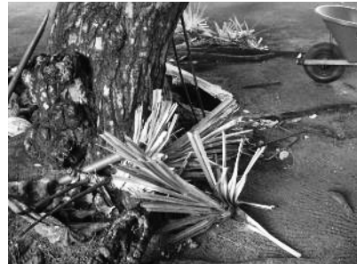
図8 タコノキの植林用苗木作り