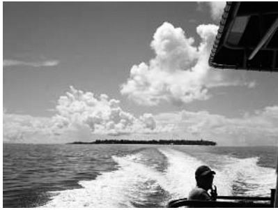
図2 メジャト島遠景