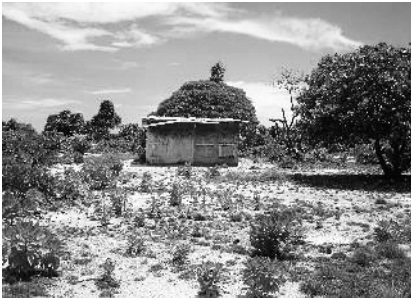
図6 空き家になった家

この10年間で避難島の人口は減ったものの、次にみるように、島の中の日常的な活動と隣のエバドン島との間の関係性の側面からみると、むしろ生活は活性化している。