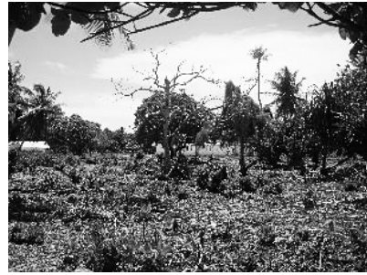
図7 植林前に灌木や雑草を取り除いた場所

植林して成長した木の実から、保存食を作る。ココヤシの実からは、「アメタマ ( ametama )」と呼ばれるキャンデーが、ココヤシの幹の樹液からは各種ココヤシシロップが作られる。パンノキの実からは「ビーロー ( bwiro )」と呼ばれる発酵保存食が作られる。タコノキの実からは、「ジェンコン ( jaankun )」という保存食ができる。