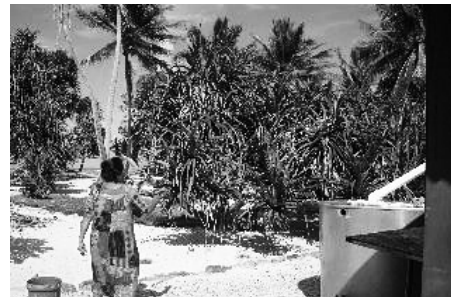
図21 エドバン島から送られた苗によって育ったタコノキ