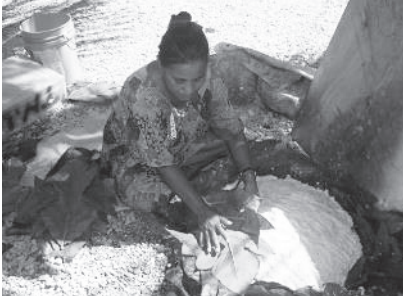
図 11 ビーローの発酵をうながす