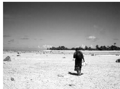
図22 メジャト島で商品を購入し、エドバン島に持ち帰る男性