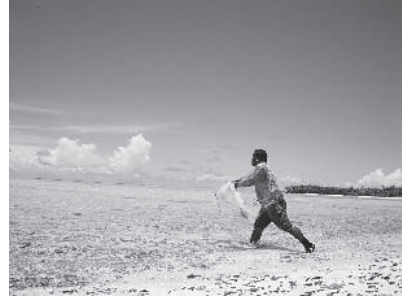
図 14 個人での漁