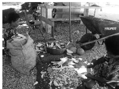
図10 ビーローを作るためのパンノキの実の処理