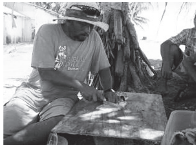
図 16 魚をさばくのは男性の仕事

漁労活動が2002年の調査時に比べて格段に増加していた。これは以前はわからなかった潮の流れなどがかなり理解できるようになってきたために、漁労活動の回数、範囲とともに増加したと考えられる。