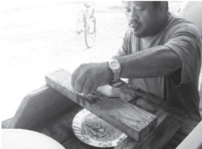
図 12 タコノキ羊羹づくり