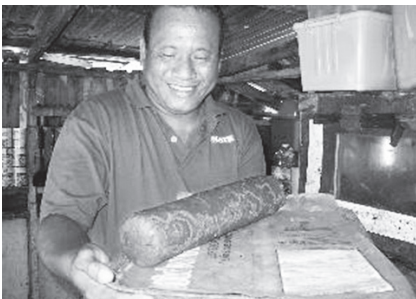
図 13 完成したタコノキ羊羹を手にする男性