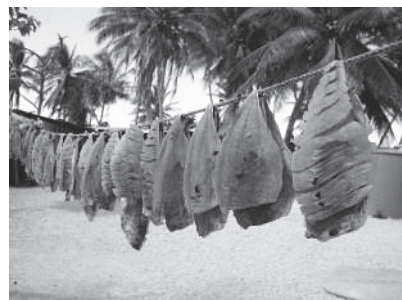
図 17 干物にされた魚

漁労活動が2002年の調査時に比べて格段に増加していた。これは以前はわからなかった潮の流れなどがかなり理解できるようになってきたために、漁労活動の回数、範囲とともに増加したと考えられる。