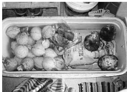
図25 メジャト島から持ち帰った食料