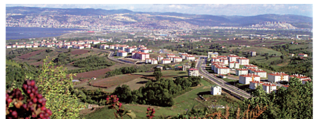
▲被災地郊外にある新興住宅地(完成直後)。現在では団地周辺に開発が進んでいる。

加えて、復興事業で支援の対象外となった賃貸層の低所得世帯のための住宅取得プロジェクトが、10 年にわたる市民団体の粘り強い活動の結果として進行中である。対象となる世帯は地震で借りていた住宅を失い、地域外に転居したり、安全性には不安が残る半壊住宅を賃借していることが多い。震災後に活動した市民団体の活動が終息していく中でこういった団体による住宅取得プログラムや雇用創出のための試みが、今後も展開して欲しいと願っている。