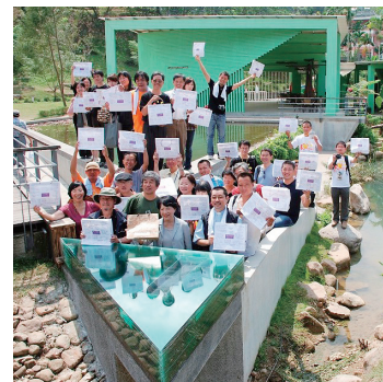
◀インスタレーション「袋子的願望」の前に「袋子的願望」を手にした参加者たち。台湾、日本それに中国大陸からの参加者が一堂に(前列中央は台湾文化庁長官)

人と人、地域と地域の交流であればたやすく国境を越えられる。ペーパードームがこれからもそうした役割の一つを担っていくことを願いたい。