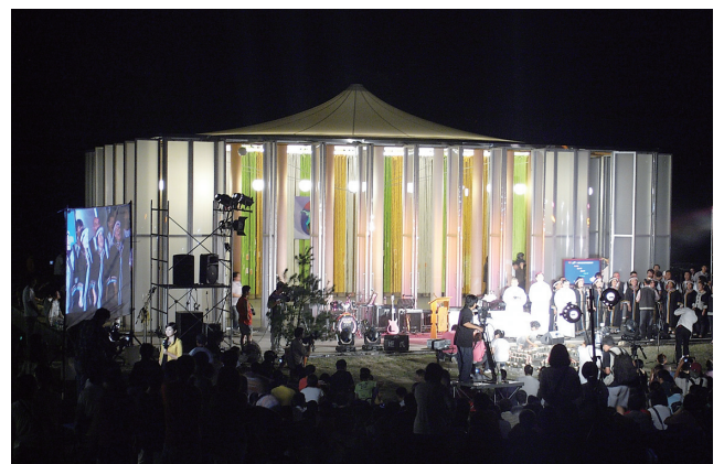
▲ 921地震10周年イベントの様子（桃米村、ペーパードームの前にて）

台湾では、大勢の方々とお会いすることができた。台湾の921地震の復興にかかわっている方々、中国の汶川地震の復興にかかわっている方々、そして、日本の各地（神戸、能登など）の復興にかかわっている方々に。さながら、様々な現場で、それぞれにお会いしている皆が一堂に集まった同窓会のような会であった。そして、皆様と楽しく交流をさせていただいた。そこで思ったことは、やはり、中越地震からの復興は、過去の被災地、そして、様々な方々に支えられているということである。皆様が、持続可能性という課題について、中越の中だけで悩んでいた我々に一筋の光をもたらしてくれた。そして、何よりも、支え続けてくれている大勢の皆様、いや、多様な仲間とのつながりを感じた台湾921地震10周年であった。