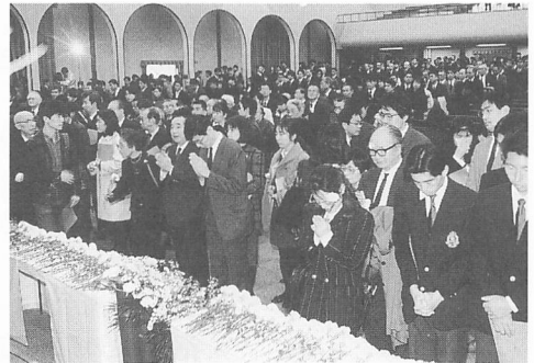
中央講堂での追悼礼拝

当日は、学生の遺族80人をはじめ約2,000人が参列し、かつて本学で「日本国憲法」などの講義を担当した土井たか子衆議院議長も出席した。会場には祭壇にユリやカーネーションと共に遺影が飾られ、讃美歌の流れる中、荘厳な雰囲気の中で礼拝は始められた。武田理事長、柚木学長、木村同窓会長がそれぞれ追悼の辞を述べ、宮田院長の挨拶の後、最後に参列者全員が、壇上でこやかに微笑む遺影に深いおもいを込めて献花し、悲しい別れを告げた。