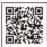
関西学院初等部 入試案内ページ

「入力準備シート」を本校ホームページに掲載しておりますので、入力時間の短縮と誤入力を防ぐためにご活用ください。