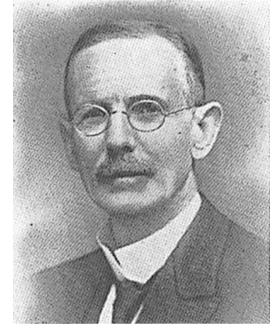
関西学院創設者 W. R. ランバス

関西学院大学は、このミッションに共感し、大学での学びや諸活動の中で、自分への挑戦をし続ける意欲にあふれ、さまざまな適性を有する多様な背景をもった学生・生徒を世界のあらゆる地域から受け入れます。そのために、これまでに培われた確かな基礎学力、活動や経験を通じて身に付けた資質、能力、学ぶ意欲や人間性などを、多様な入試制度により多角的に評価することを基本的な方針としています。