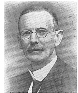
関西学院創設者 W. R. ランバス

関西学院大学は、このミッションに共感し、大学での学びや諸活動の中で、自分への挑戦をし続ける意欲にあふれ、さまざまな適性を有する多様な背景をもった学生・生徒を世界のあらゆる地域から受け入れます。そのために、これまでに培われた確かな基礎学力、活動や経験を通じて身に付けた資質、能力、学ぶ意欲や人間性などを、多様な入試制度により多角的に評価することを基本的な方針としています。