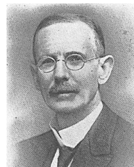
関西学院創設者 W. R. ランバス

関西学院大学は、このミッションに共感し、大学での学びや諸活動の中で、自分への挑戦をし続ける意欲にあふれ、さまざまな適性を有する多様な背景をもった学生・生徒を世界のあらゆる地域から受け入れます。そのために、これまでに培われた確かな基礎学力、活動や経験を通じて身に付けた資質、能力、学ぶ意欲や人間性などを、多様な入試制度により多角的に評価することを基本的な方針としています。