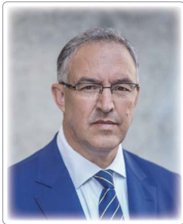
| 講演者 | ロッテルダム市長 アーメッド・アブターレブ Ahmed Aboutaleb

Rotterdam : A diversified entrepreneurial region in transition to the next economy