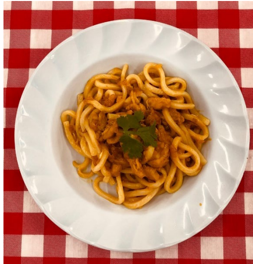
〈ビルマ風まぜうどん〉