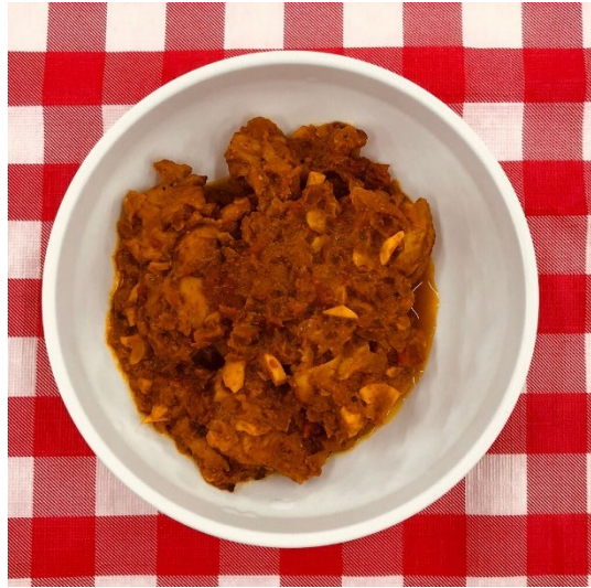
〈まろやかチキンカレー〉