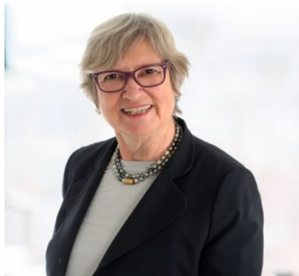
インゲボルグ・シュヴェンツァー教授

ドイツ・シュトゥットガルト出身。フライブルク大学およびジュネーブ大学で法律を学ぶ。フライブルク大学比較・国際司法研究所にて法学博士。1978年最優秀博士論文Herrnstadt Award受賞。カリフォルニア大学バークレー校法学修士。2010年からスイス バーゼル大学名誉教授。2011-2018年CISG Advisory Council 議長。国際統一売買法(CISG)・仲裁法研究の世界的な第一人者。現在、スイス国際ロースクール学長。