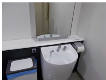
オストメイト対応