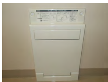
フィッティングボード