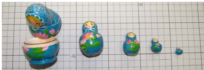
図：身近なフラクタル構造であるロシアの民芸品、マトリョーシカ。

自分の図形の中に自分自身と相似（自己相似）な図形を内包している構造をフラクタルといいます。ロシアの民芸品であるマトリョーシカのような構造のことで、人形の中を開けるとまた人形が、その中にまた人形が入っています。このフラクタルを特徴づけるために、フラクタル次元 D_f (fractal Dimension) を用います。フラクタルを有する図形の大きさ ( y ) の分布は距離 ( x ) に対して「べき乗則： y = ax^{-D_f} 」で表され、両対数プロットの傾きから D_f を求めることができます。