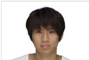
図 2 提示した人物情報例(中国-ポジティブ条件)

彼は、高校時代は3年間吹奏楽部で活動していました。彼をよく知る人々は、彼のことを あなた かく、精力的で、知的で、決断力があり、将来有望な人物だと評しています。