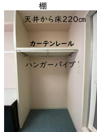
奥行55cm 幅 120 cm