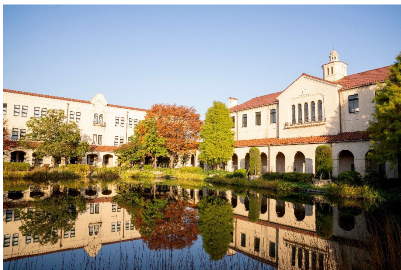
大学院 2 号館、本部棟（西宮上ヶ原キャンパス）