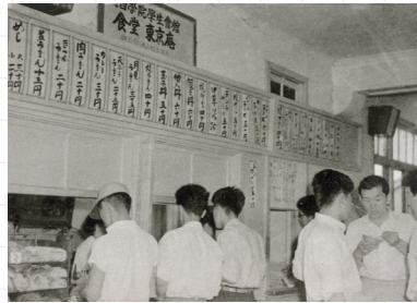
東京庵 1958年（『商学部卒業アルバム』）