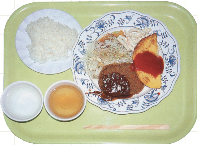
コープランチ（BIG PAPA）1995年 （『関西学院大学卒業アルバム』）