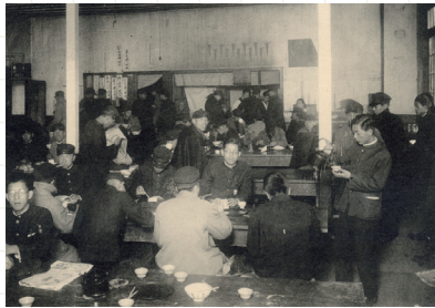
原田の森時代の学生食堂 1929年 （『高等商業学部第14回卒業アルバム』）

表面使用画像（右上より時計回りに）：ホットケーキ（Arcadia）2020年（『関西学院大学卒業アルバム』）、弓道部1928年（『文学部第11回卒業アルバム』）、九州沖縄フェアの熊本ラーメン（BIG PAPA）2025年、相撲部1928年（『高等商業学部第13回卒業アルバム』）、管理栄養士定食（BIG PAPA）2025年、学院食堂の食器1950年代-1978年か、学生食堂1934年（『高等商業学部第19回卒業アルバム』）、アイスホットケーキ部1999年（『関西学院大学体育会卒業アルバム』）、水上競技部1929年（『高等商業学部第14回卒業アルバム』）、豚生焼き定食（カスタマイズ後）（東京庵）2024年、柔道部1928年（『高等商業学部第13回卒業アルバム』）