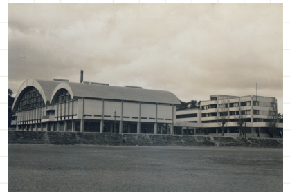
総合体育館と学生会館旧館 1959年頃