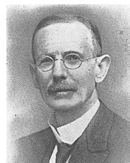
関西学院創設者 W. R. ランバス

そのために、これまでに培われた確かな基礎学力、活動や経験を通じて身に付けた資質、能力、学ぶ意欲などを、多様な入試制度により多角的に評価することを基本的な方針としています。