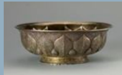
鍍金龍池鴛鴦双魚文銀洗