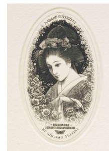
マダムバタフライ(蝶々婦人)