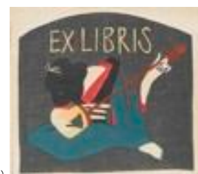
竹久夢二 三味線(復刻)