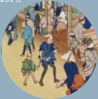
「浪花百景」天下茶やぜさい より

学校法人関西学院と財団法人颯川美術館との連携協力協定締結を記念して、颯川美術館所蔵の浮世絵「浪花百景」を一挙展覧いたします。「水の都」、「天下の台所」と呼ばれ活気に溢れる150年前の大坂へ名所を巡る旅に出かけましょう。