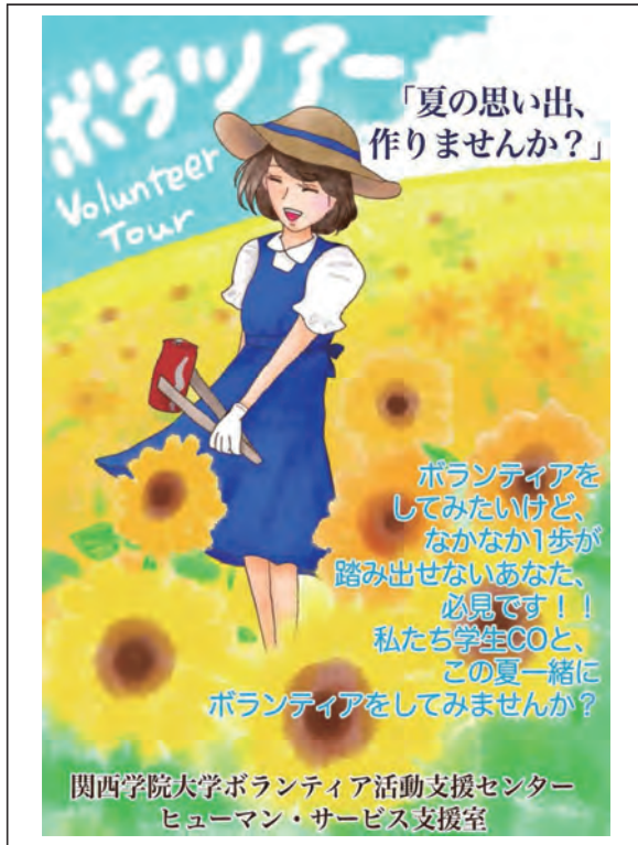
ボラツアーチラシ 表