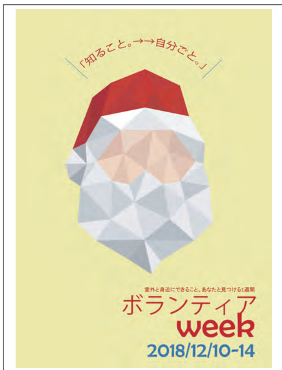
ボランティア EXPO チラシ 表