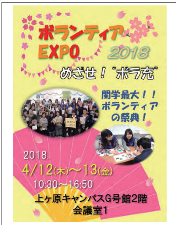
ボランティア EXPO チラシ 表