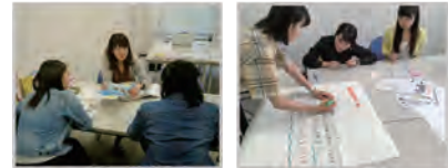
コーディネートの様子