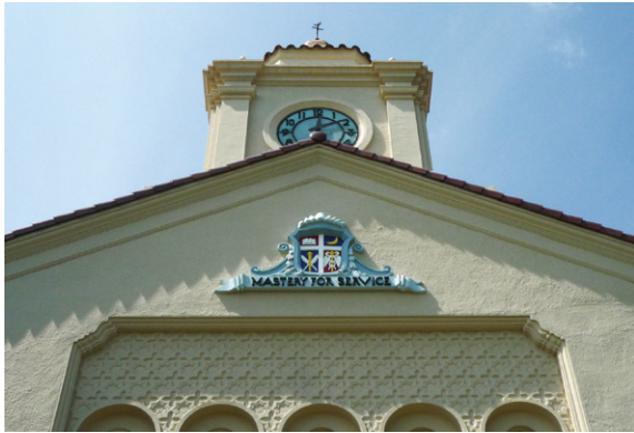
時計台 (大学博物館)・エンブレム