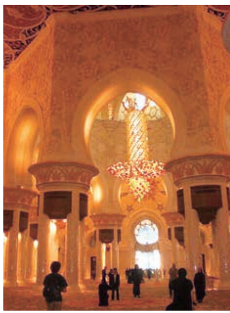
↑首都・アブダビにあるイスラム教徒たちの礼拝所、グランドモスク

日本人である私にとって、これらの習慣、文化を理解することは時に容易ではありませんでした。しかし自国とは全く違った地で暮らす中で、自分にとっての「当たり前前の価値観」が他者にとって当たり前前ではないことを学びました。