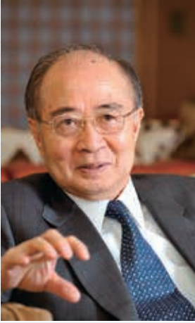
明石康・元国連事務次長 (SGU招聘客員教授)