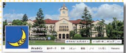
アカウント名 関西学院大学 / Kwansai Gakuin University

関西学院大学の身近なニュース、キャンパス風景、動画などを紹介。Facebook大学別ファン数ランキングで1位を獲得しています(facenaviより http://facebook.boj.jp/facebook-university-ranking )。今すぐ「いいね!」をしよう。