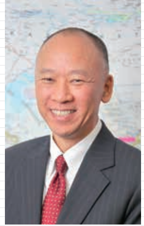
久木田純・前国連児童基金 (UNICEF) カザフスタン事務所代表 (SGU招聘客員教授)

2 2017年4月、関西学院大学大学院に副専攻「国連・外交コース」を開設します。本コースは、大学院博士課程前期課程(修士)および大学院専門職課程(専門職学位)レベルの副専攻プログラムです。