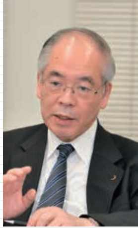
神余隆博・元ドイツ大使、元国連政府 代表部大使(副学長)