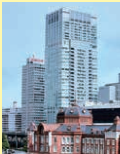
東京丸の内キャンパスのあるサピアタワー

で活動する際は、気軽に利用してください。活動が進むにつれて、新たな疑問や不安、聞いてほしいことがある人は多いと思います。そんなときには大阪梅田キャンパスのキャリアセンターに相談してください。「学内企業説明会」も随時開催されます。情報は随時更新されますので、「KGキャリアナビ」を確認しましょう。