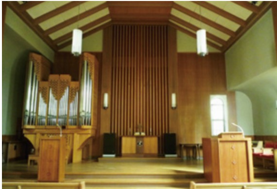
西宮上ヶ原キャンパス ランバス記念礼拝堂