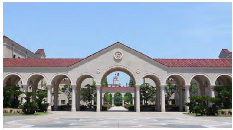
神戸三田 キャンパス